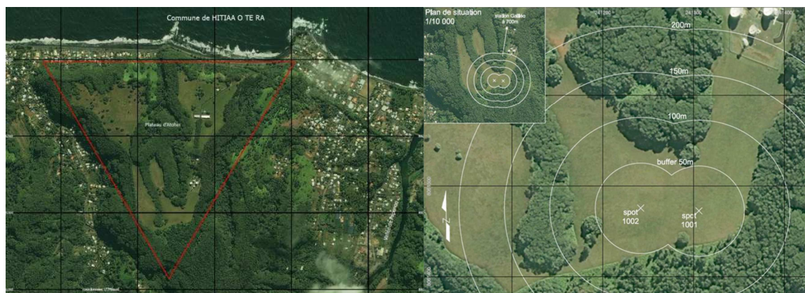
Terrain de TNT (dans le triangle rouge)

TNT possède un terrain de 85 ha dont 72 ha sur le plateau d'Atohei situé sur la commune de Papeete au nord de l'île de Tahiti. La partie envisagée sur la partie sud du plateau (17,5178°S, 149,4370°W) est constituée d'une clairière d'environ 1,5 ha en fer à cheval à une altitude moyenne de 200 m et en pente relativement constante de 13 cm/m du nord au sud.