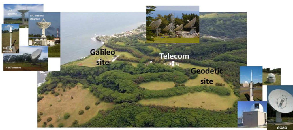
Vue d'avion des sites Galileo, Telecom et futur géodésique

Il est à noter que l'extrémité tahitienne du câble sous-marin à fibres optiques Honotua en provenance d'Hawaii arrive directement dans les locaux de TNT. Un autre câble à destination de la Nouvelle-Calédonie est projeté.